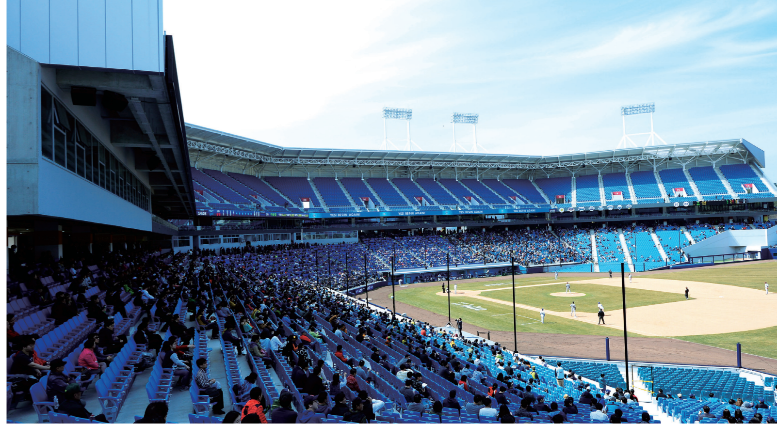
삼성라이온즈파크는 거의 모든 공간이 구단 상징 컬러인 파랑으로 덮여 있다

야구장이 창원NC파크다. 창원NC파크는 미국의 유명한 스포츠 시설 건축 회사에서 설계했다. 국내 야구팬들에게는 국내 프로야구장 중 미국 프로야구장과 가장 유사한 곳으로 유명하다. 창원NC파크는 야구 경기 자체에 집중했는데 그중에서도 야구장의 그라운드 컨디션을 강조함으로써 선수들의 경기력을 강조했다. 또한 관람석을 안락하고 자유롭게 조성해 경기에 집중할 수 있는 분위기를 연출했다. 분위기 연출은 경기장의 기술력과 서비스를 중심으로 진행되면서 야구장이라는 무대 공간을 더욱 풍성하게 한다. 창원NC파크는 스포츠 공간 문화를 체득할 수 있는 콘텐츠가 다양하다. 외야의 자유로운 좌석 배치, 사회적 약자 배려, 지역사회 연결 등의 콘텐츠들을 보고, 듣고, 맛보고, 만짐으로써 스포츠 공간 문화 가치가 가득 채워졌다. 과연 앞으로는 어떤 스포츠 공간 문화들이 이곳, 창원NC파크에 쌓일지 기대된다.