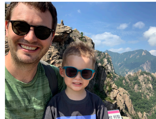
데빈은 종종 어린 아들과 산에 오른다

데빈은 역동적인 스포츠에 더 끌린다고 했다. 트레일 러닝에 마음이 사로잡힌 것도 이 때문이다. 데빈은 도로나 서울의 대교에서 자동차들과 나란히 달리는 것이 지루했다. 도로와 자동차가 아닌 강과 숲, 산을 배경삼아 달리는 것, 즉 트레일 러닝이야말로