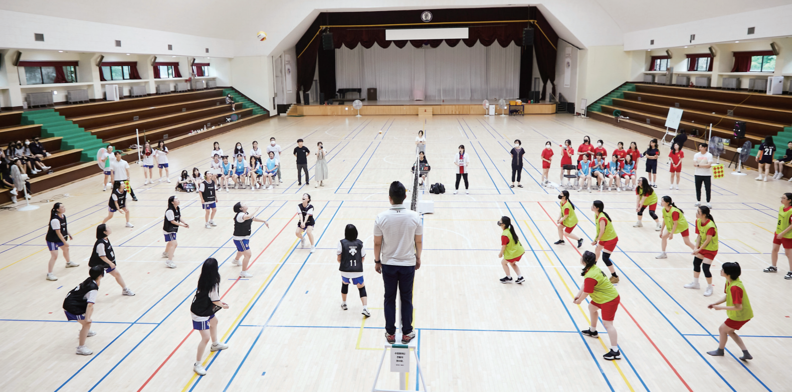
챔피언십을 거머쥐기 위한 학생들의 열기가 동덕여자고등학교 체육관을 가득 채웠다

평소 수업 시간에는 듣지 못했을 최신 가요에 맞춰 몸을 움직이는 학생들과 호루라기를 불며 학생들을 지도하는 선생님, 경기장 앞에 놓인 생수와 얼음 등등. 눈앞의 것들을 하나하나 곱씹으니 영락없는 체육대회다. 개성 넘치는 유니폼을 맞춰 입고 학급의 단합력을 높이는 학생들, 화려한 페이스페인팅으로 상대 팀의 기선을 잡는 학생들, 본 경기를 앞두고 몸 푸는 학생들, 체육관 바닥과 운동화 밑창이 부딪쳐 일으키는 마찰음까지. 여름방학을 일주일 앞둔 1학기 끝자락, 동덕여자고등학교 1학년 학생들이 '챔피언십(Championship)'을 차지하기 위해 책상이 아닌 배구 코트 위로 모여들었다. 그 이름이 바로 '제1회 동덕 배구 챔피언십'이다. 5일 동안 2, 3교시에 열린 1학년 학급 대항 배구 대회다. 학생들은 기말고사로 잔뜩 긴장했던 근육과 학업 스트레스를 풀고 방학으로 들뜬 마음을 가라앉히며 체육 시간에 쌓은 배구 실력을 마음껏 발휘했다.