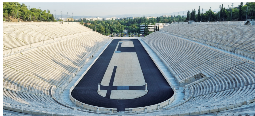
기원전 6세기경에 처음 건축된 아테네의 판아테나이아 스타디온은 기원전 330년경과 서기 144년에 석재로 재건됐다. 이후 1896년 제1회 아테네 근대올림픽과 2004년 아테네 올림픽의 경기장으로 사용됐다