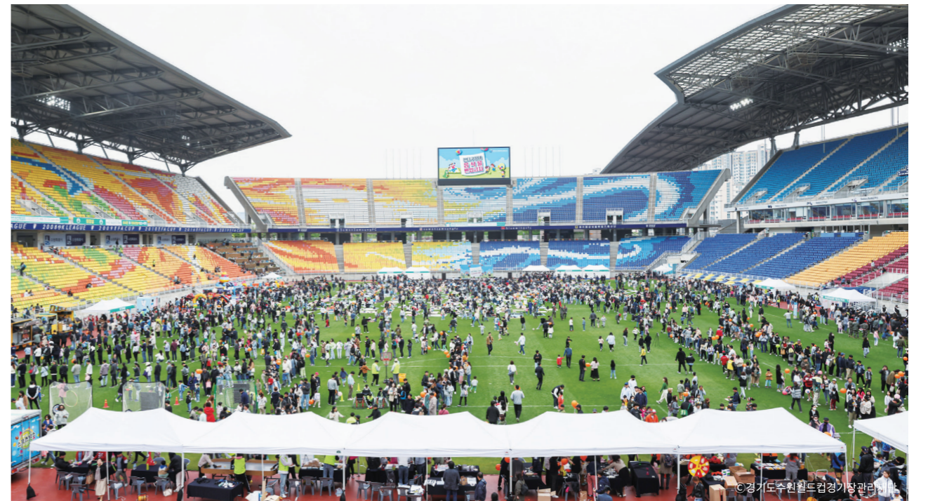
수원월드컵경기장은 어린이날을 맞아 지역에 거주하는 어린이들을 위해 경기장을 개방했다

런 것들을 만들어 세계로 전파시키는 노력이 이뤄졌다. 이러한 흐름 속에서 지역의 맥락(Context)과 정체성(Identity)이 무시되고 획일화된(Homogenized) 문화가 여러 지역을 지배하는(Dominant) 경우가 많았다. 경기장도 스포츠 문화가 조금 더 앞서 발전된 나라와 지역의 경기장이 최고인 것으로 여겨지고, 그것들이 마치 전 세계 어디에 있어도 좋은 경기장이 될 것으로 착각한다. 경기장은 그 지역의 스포츠 문화를 담은 그릇(Container)이다. 같은 종목의 스포츠가 열리는 경기장이라 하더라도 그 경기를 관람하는 팬들의 성격과 문화가 다르고 스포츠 콘텐츠를 소화하는 방식도 다르다. 앞서 팬들은 다양한 이유와 목적을 가지고 경기장을 찾았다고 했듯이 지역에 따라 이 이유와