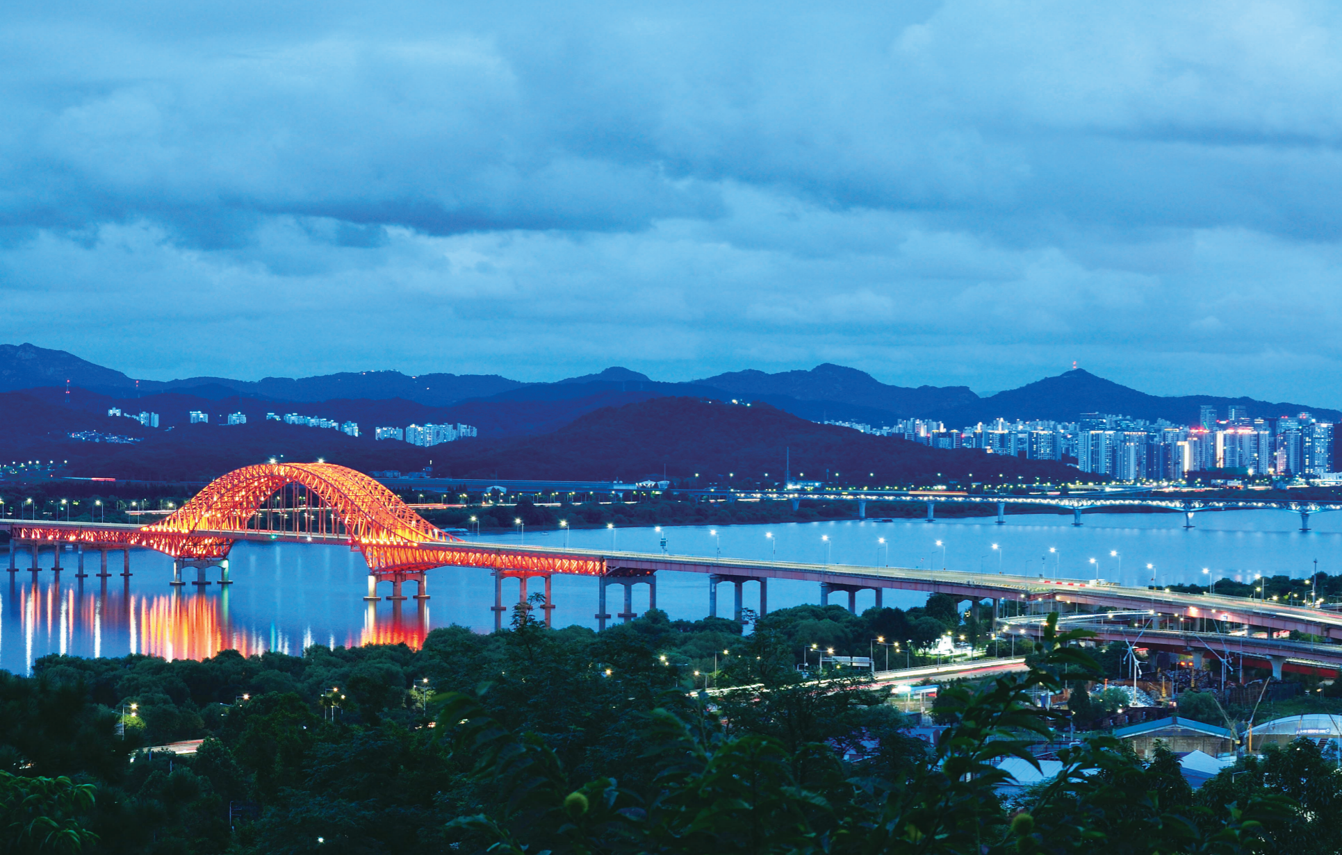
‘개화산 숲길’로도 불리는 강서둘레길1코스를 따라 걸으면 한강이 한눈에 보이는 전망데크가 나온다