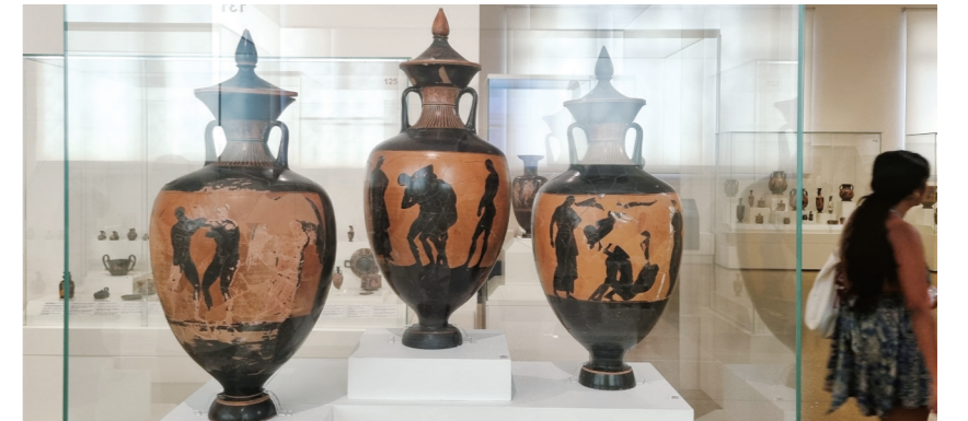
아테네 고고학박물관이 소장한 암포라로 판아테나이아 경기 우승자에게 주어졌다. 한 면에는 선봉장 아테나(Athena Promachos)가 그려지고 다른 면에는 해당 종목이 묘사된다

다. 즉, 대(大)판아테나이아 운동경기는 비아테네 출신 선수들을 위한 경기가 아고라-스타디온을 중심으로 치러지고, 아테네 출신 선수들을 위한 경기는 아카데메이아-아고라-스타디온-사로니코스만에 이르는 넓은 지역에서 치러졌다. 특히 기원전 4세기에 대(大)판아테나이아의 스포츠 공간 확장에는 아테네의 강력한 해상력을 대외에 선보이고자 하는 의도와 더불어 부족 간의 결속을 다짐으로써 아테네인들에게 폴리스에 대한 연대 의식을 강화하려는 목적이 있었다. 아카데메이아에서 수니온에 이르기까지 아테네의 영역을 경기장의 공간으로 아우름으로써 너른 아티카(Attica) 지역에 거주하는 구성원들에게 아테네인으로서의 소속감을 높이고 공동체 의식을 강화하는 효과를 기대할 수 있었다.