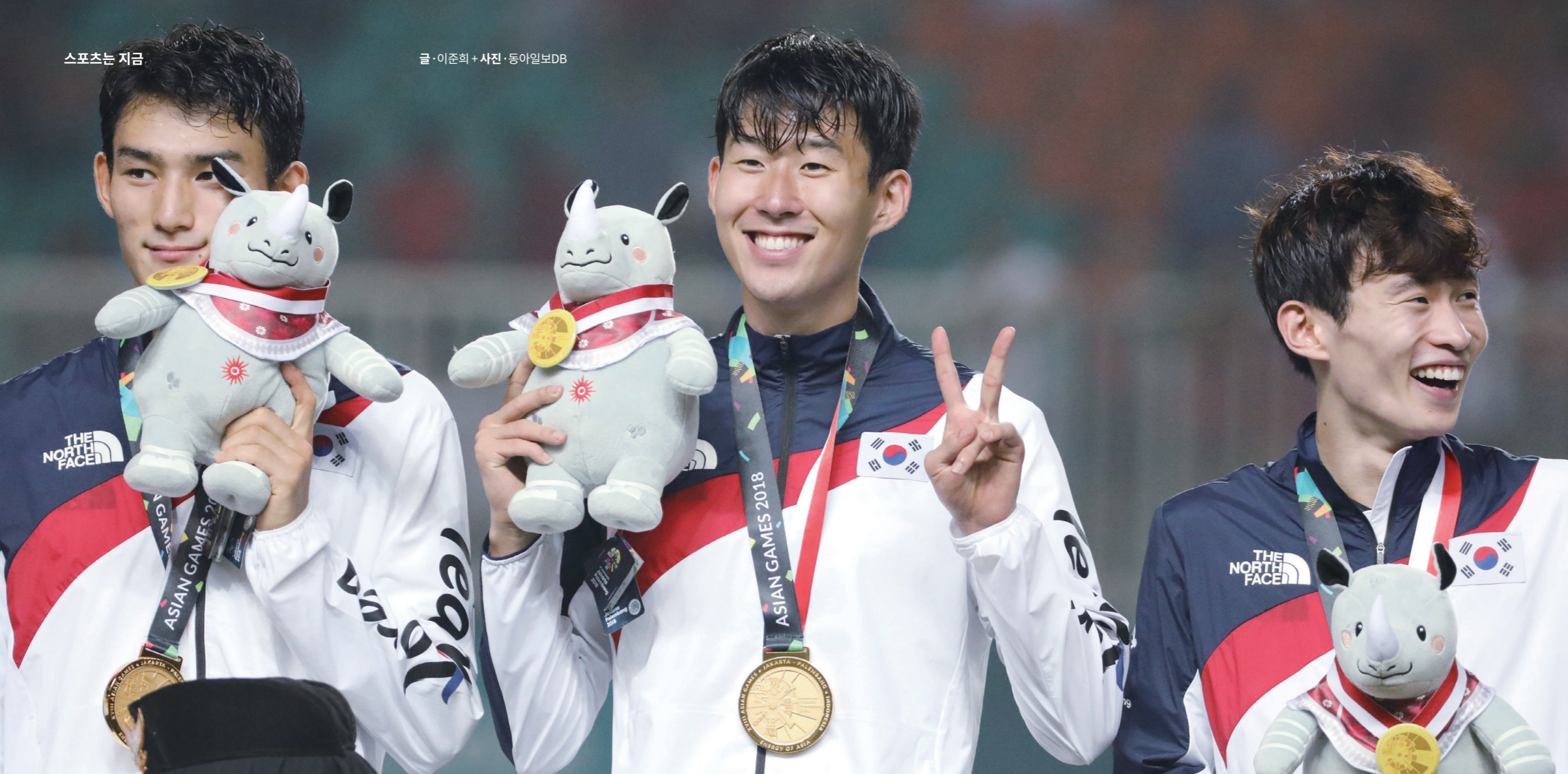
지난 2018 자카르타-팔렘방 아시안게임 축구 결승전에서 일본과 맞붙은 대표팀이 금메달을 목에 걸고 승리의 웃음을 보이고 있다