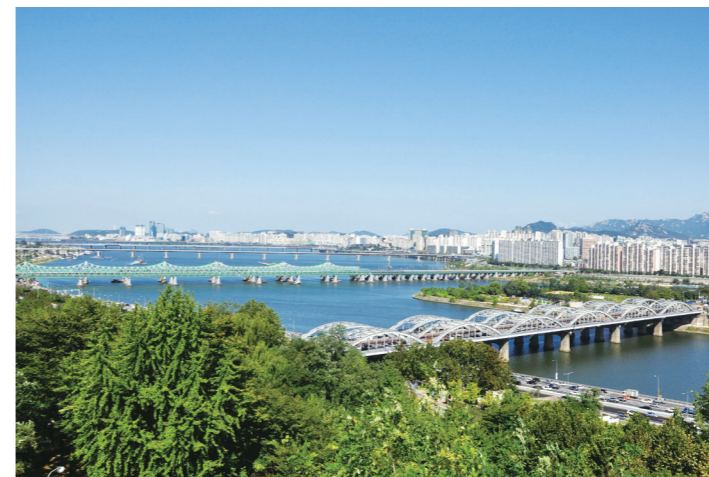
서달산은 서울시 동작구에 있는 산으로 국립현충원을 에워싸고 있다

걷는 것을 좋아하는가? 그렇다면 걷기 좋은 숲길은 어떤가? 단순히 걷기 좋은 것이 아니다. 한강을 내려다볼 수 있는 전망대까지 갖춰져 있다. 한강을 가까이 하면서 걷기까지 좋은 산을 꼽으라면 동작충효길에 있는 고구동산과 서달산을 바로 추천하겠다. 뽀뽀한 잣나무 숲과 숲 치유를 체험할 수 있는 힐링테크가 잘 조성돼 있다. 곳곳에 벤치도 있어 걸다가 지칠 때