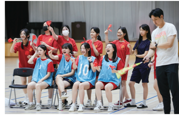
경기에 출전하지 않은 학생들이 코트 위 친구들에게 힘껏 응원을 보내고 있다