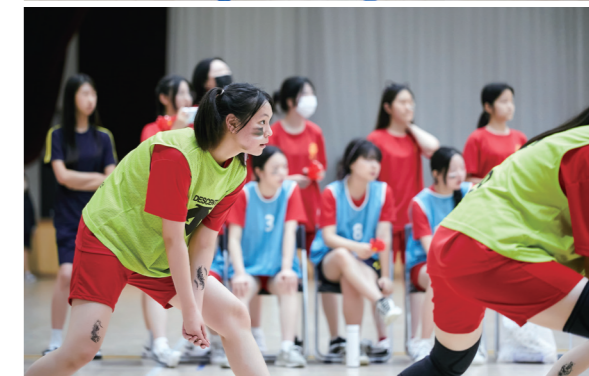
경기가 시작되자 학생들이 배구공에서 시선을 놓치지 않고 있다

라며 "학기 초에는 조용하고 차분한 분위기에서 배구 수업을 진행했는데 시간이 흐를수록 학생들의 웃음소리와 적극적인 의사소통으로 '아름다운 소리'가 체육관에 가득했다"고 전했다. 코트 안팎의 학생들 소리가 아름답게만 들린 것은 장효원 교사만이 아니었다.