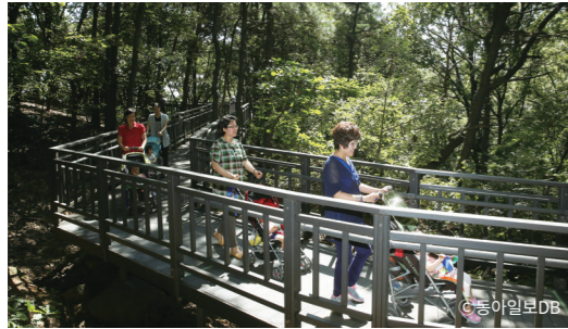
무장애길인 개화산숲길은 유아차와 휠체어 모두 편리하게 이동할 수 있다

에서 계단을 오르면 양쪽으로 이어진 증미산둘레길이 있고 직진해 계단으로 올라가면 증미산 전망대로 바로 향한다. 사실 어떠한 길을 선택해도 전망대로 이어지기 때문에 도전을 불러일으키는 곳을 선택하면