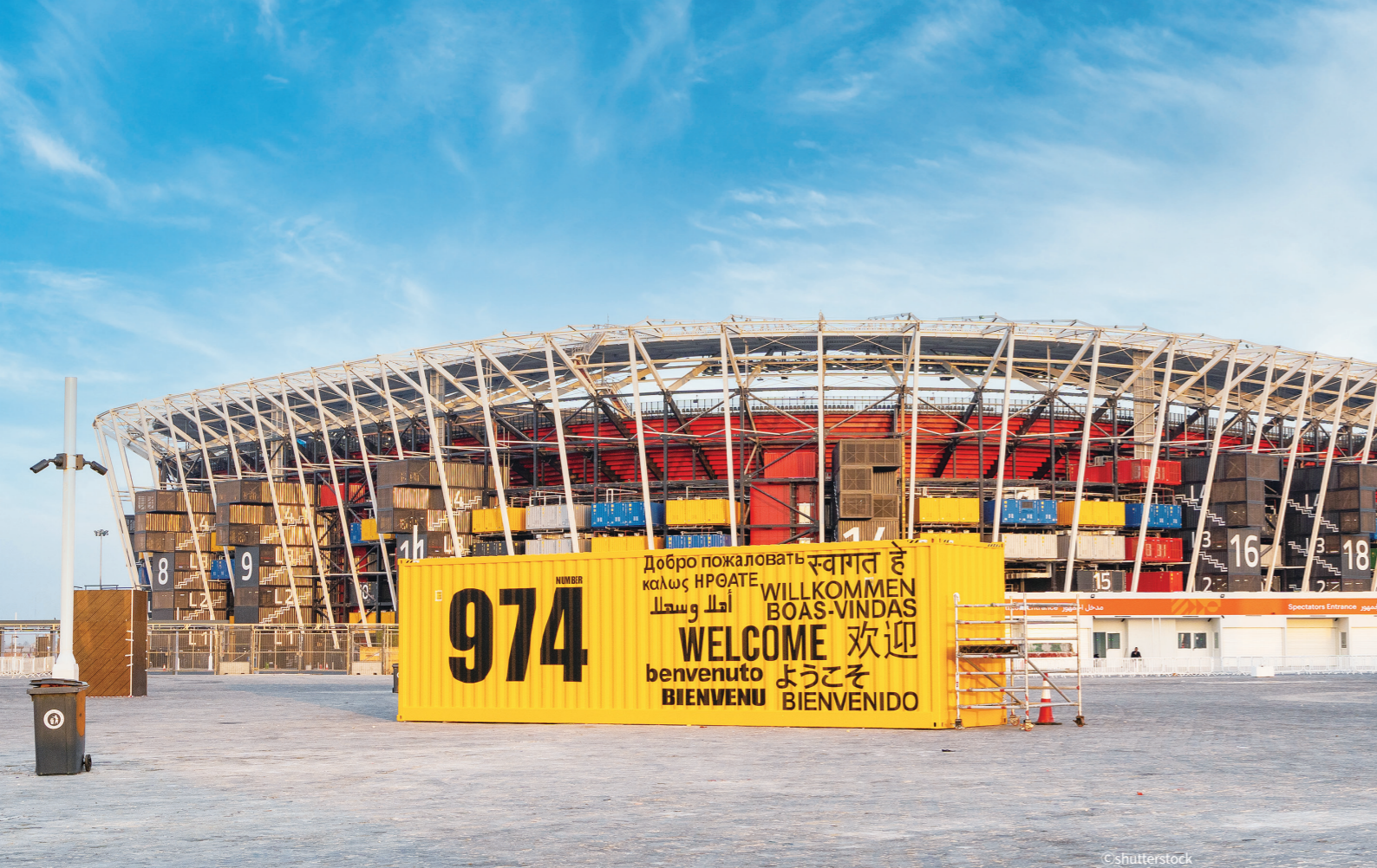
카타르 도하 스타디움 974(옛 이름 '라스 아부 아부드 스타디움')는 974개의 재활용 운송 컨테이너로 만들어진 임시 축구 경기장이다