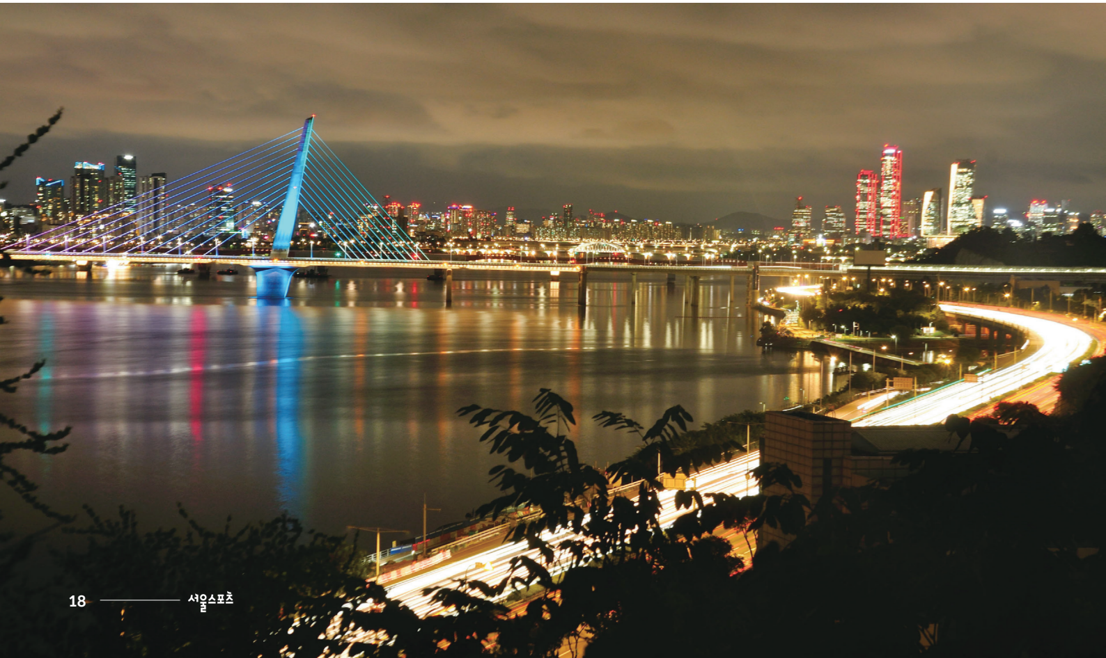
증미산 전망대에 오르면 월드컵대교와 한강이 시원하게 펼쳐져 있다

된다. 증미산 산자락을 따라 뽀뽀한 숲길을 걸어보자. 여름에는 매미 울음소리가 가득하고 봄과 가을에는 숲길 옆에 다양한 야생화가 즐비하게 피어난다. 전망대에 다다르면 가장 먼저 흔들의자가 눈에 들어온다. 소나무 아래에 놓인 흔들의자에 앉아 눈앞에 펼쳐진 한강을 바라보자. 정면에는 상암동에 있는 하늘공원과 노을공원이 한눈에 들어온다. 오른쪽으로는 월드컵대교는 물론 저 멀리 성수대교까지 보인다. 해가 지면 한강의 다리들은 일제히 붉은색의 가로등을 켜고 아름다운 야경을 만든다. 증미산 전망대는 접근성이 좋지만 찾아오는 사람은 드물다. 화려한 장관에 비해 아직 알려지지 않은 숨은 명소다. 개화산보다 훨씬 더 다이내믹한 도심 야경을 감상할 수 있다.