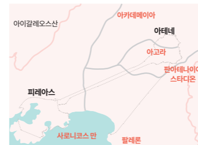
기원전 4세기경 판아테나이아의 주요 스포츠 공간

경기장은 선수들의 출신과 종목에 따라 위치가 달랐다. 종목별로 경기장의 위치를 살펴보면 아테네 선수가 참여하는 경기와 다른 폴리스 출신 선수가 참여하는 경기의 수행된 공간적 구성에 차이가 있었다. 다른 폴리스 출신 선수가 참여하는 육상경기는 아고라와 스타디온에서 치러졌다. 마상 경기도 아고라에서 열리다가 팔레론에 있는 경마장에서 치러졌다. 아테네인만이 참여할 수 있었던 횡단 경주와 희생제는 아카데메이아에서 아크로폴리스까지 이어지는 공간에서 벌어졌다. 역시 아테네인만이 참여했던 해상 경기도 피레우스와 팔레론, 멀리는 수니온곶에 이르는 사로니코스만의 해안에서 벌어졌