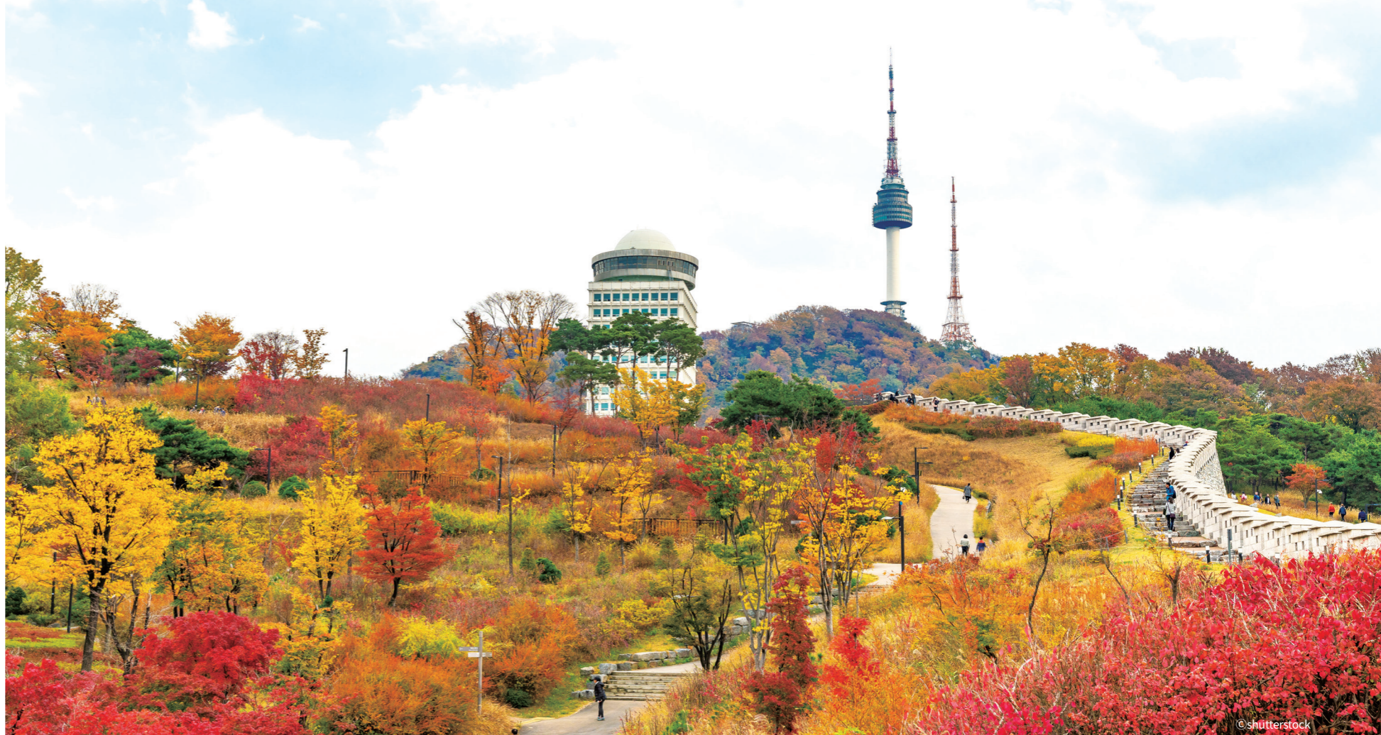
남산둘레길은 봄이면 '벚꽃둘레길'로, 가을에는 '단풍둘레길'로도 유명하다

도심의 야경이 빌딩 조명으로 가득해 산만하다면 한강이 내려다보이는 야경은 웬지 모르게 마음이 차분해지며 진득한 감상에 젖게 된다. 한강 뒤편으로 어둡게 보이는 관악산과 대모산, 구룡산이 병풍을 쳐놓은 것처럼 둘러싸고 있다. 게다가 다른 지역의 여느 전망대보다 한강을 바라보는 풍경도