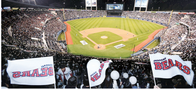
서울시는 2028년 개장을 목표로 현 잠실야구장을 스포츠, 전시, 공연 등이 어우러진 스포츠 MICC 복합문화 공간으로 탈바꿈한다는 계획이다

가장 대중적인 것이 가장 인간적일 때가 있다. 국내 프로스포츠 중 가장 대중적인 종목은 단연 야구다. 야구를 제대로 즐기려면 야구장이라는 공간을 이해해야 한다. 이에 ‘스포츠 공간 문화’를 다룬 이 글은 국내 프로야구 종목을 중심으로 이야기를 펼쳐 나간다. 그중에서도 공간적 경험을 현시점의 스포츠 문화로 접근해 ‘야구장의 공간적 가치’를 재해석했다.