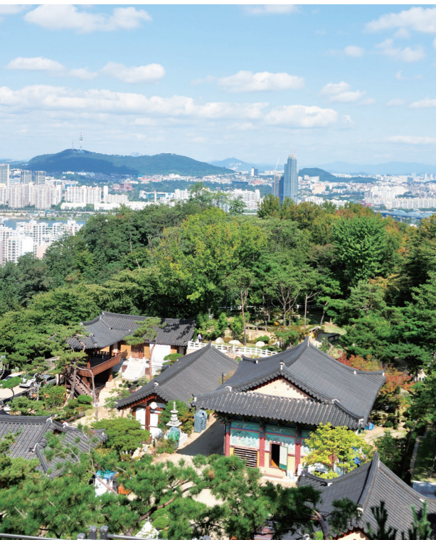
한강을 바라보는 거북바위를 보러 서달산에 있는 달마사를 찾는 이도 많다