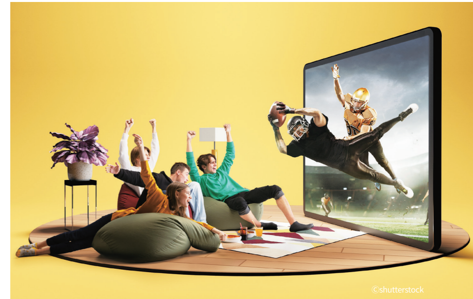
디지털 기술의 발전으로 실내에서 스포츠를 즐기는 이들이 많아지면서 경기장에서의 새로운 경험이 절실한 상황이다

나는 선수들의 경기 장면에만 국한되지 않는다. 팬들간의 상호작용과 개인이 아닌 집단에 대한 소속감 등 많은 행위와 감정의 공유가 필드 바깥에서 이뤄진다. 나와 같은 색깔의 옷을 입고 같은 목소리를 외치는 수백, 수천, 수만의 사람이 한 공간에 있는 장면을 상상해 본다면 얼마나 가슴 뭉클한 경험인가. 우리는 다양한 이유와 목적을 갖고 경기장을 찾는다. 팀을 응원하기 위해, 직접 선수를 보기 위해, 가족이나 친구들과 먹고 마시며 즐거운 시간을 갖기 위해, 그리고 라이브이벤트 경험을 위해... 시간이 흐르고 흘러 미래가 되고 기술은 지금보다 더욱 발전된다면 아마도 우리는 거실에서 얻을 수 있는 것 보다 더 나은 편안함, 더 크고 좋은 화질의 스크린, 더 좋은 사